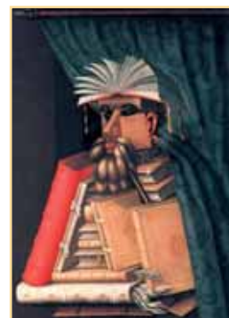
GIUSEPPE ARCIBOLDO, LE LIBRAIRE (1565)